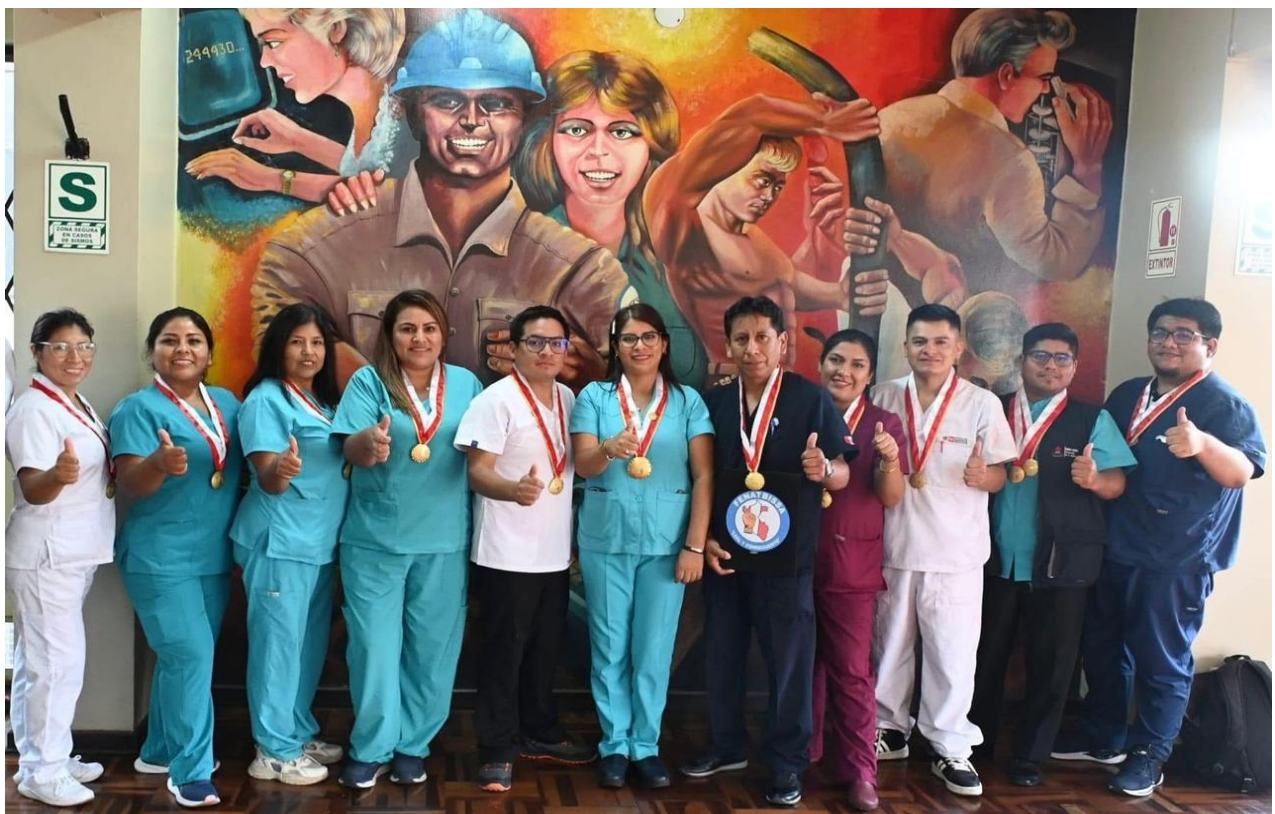
Juramentación del Consejo Directivo Nacional de FENATBISSA, Gestión 2024 – 2027 en el Auditorio del Sindicato de Trabajadores de Telefónica del Perú.

¡Vivan los trabajadores de todo el Perú!